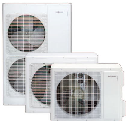
Jednostki zewnętrzne pomp ciepła typu Split Vitocal 100-S i 111-S