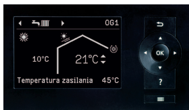
Regulator pompy ciepła Vitotronic 200

Z będącym na wyposażeniu interfejsem internetowym Vitoconnect, pompy ciepła powietrze/woda są dostępne online. Bezpłatna aplikacja mobilna ViCare udostępnia wiele funkcji, między innymi takich jak: zmiana temperatury pomieszczenia, zmiana czasów pracy, programowanie za pomocą asystenta ogrzewania oraz pozwala na komfortową obsługę za pomocą smartfona.