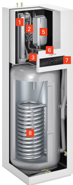
VITOCAL 100-S (u góry) VITOCAL 111-S (z lewej) Jednostki wewnętrzne