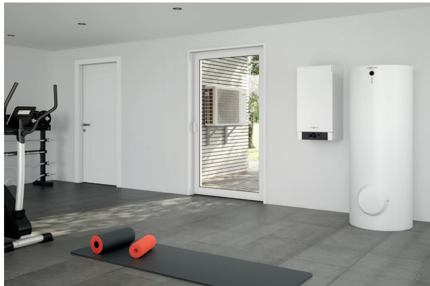
Pompa ciepła powietrze/woda typu Split Vitocal 100-S z ustawionym obok pojemnościowym podgrzewaczem c.w.u. Vitocell (z prawej) oraz jednostka zewnętrzna.

Pompy ciepła powietrze/woda Vitocal 100-S i Vitocal 111-S w typu Split składają się z dwóch osobnych jednostek: w jednostce zewnętrznej czynnik chłodniczy w parowniku obiegu chłodniczego, odbiera energię ciepłą powietrza atmosferycznemu, a sprężarka transformuje ją do poziomu temperaturowego, potrzebnego do ogrzewania pomieszczeń. Ciepło to jest następnie doprowadzane przewodem do jednostki wewnętrznej i w jej skraplaczu oddaje ciepło do sieci grzewczej. Jednostka wewnętrzna jest już fabrycznie wyposażona w elementy obiegu wodnego, takie jak trójdrożny zawór przełączający, pompa obiegowa i regulator pompy ciepła.