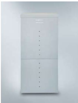
Do ustawienia wewnątrz budynku