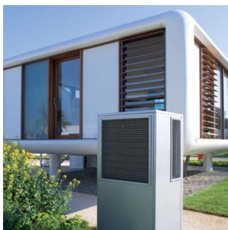
Vitocal 300-A do ustawienia na zewnątrz budynku (Silent-Version)

Poziom hałasu pracującej pompy ciepła Vitocal 300-A jest szczególnie niski w segmencie tego typu urządzeń, dzięki zastosowaniu wentylatora promieniowego z regulacją prędkości obrotowej i obniżaniu jego wydajności w trybie pracy nocnej.