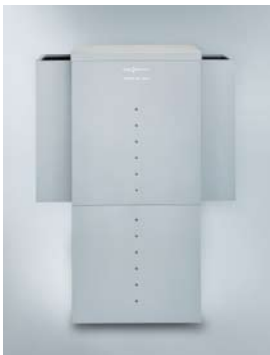
Do ustawienia na zewnątrz budynku