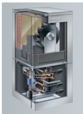
Vitocal 300-A do ustawienia wewnątrz budynku

W trybie chłodzenia obieg pompy ciepła zostaje odwrócony - odbiera ciepło z pomieszczeń i odprowadza do otoczenia. Dzięki temu uzyskuje się komfortową temperaturę w pomieszczeniach podczas upalnych dni, bez konieczności stosowania tradycyjnej klimatyzacji.