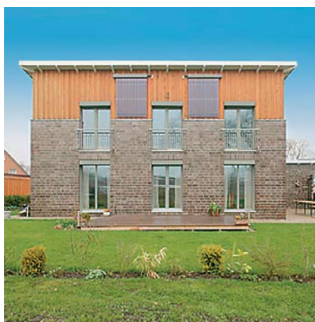
Kolektory słoneczne Vitosol 200-T powieszono pionowo na ścianie budynku.