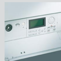
Cyfrowy regulator pogodowy Vototronic 200