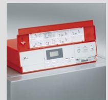
Cyfrowy regulator kotła Vitoronic 100