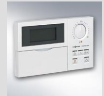
Vitolrol 300 – moduł obsługowy z tekstowym wyświetlaczem dialogowym