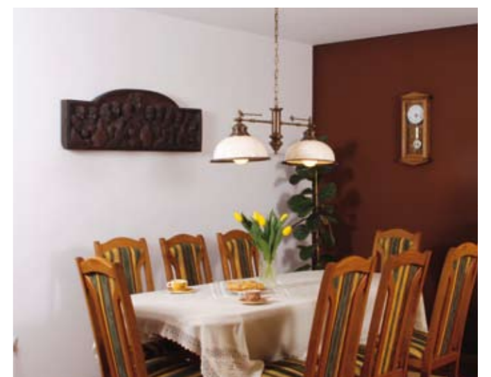
▲ Jadalnia w salonie czeka na rodzinne obiady, gdy wszyscy wreszcie są w komplecie

Niezależnie od tego, gdzie jestem, rodzina często przyjeżdża do mnie na zgrupowania. Są ze mną i kibicują mi, ale i tak tęsknię za domem, bo bardzo lubię w nim przebywać – kojarzy mi się z odpoczynkiem. ▶▶