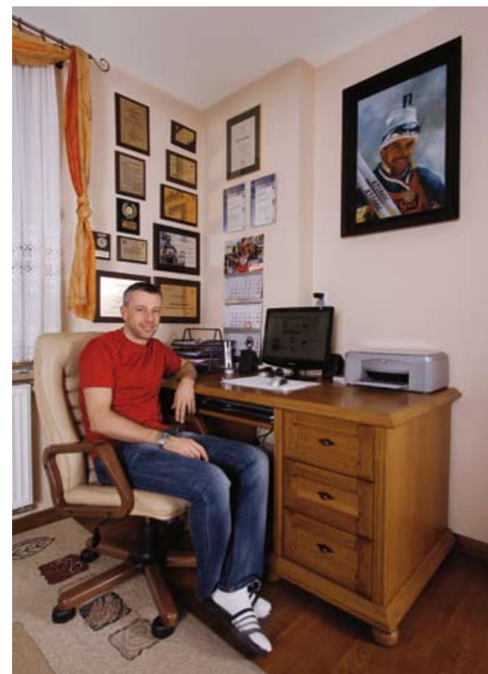
▲ Ściany gabinetu zdobią dyplomy uznania i kalendarz ze zdjęciem mistrza