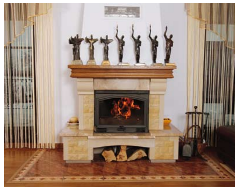
▲ Półka nad kominkiem w salonie eksponuje ważne trofea, między innymi nagrodę przyznaną przez „Przegląd Sportowy” i TVP w plebiscycie na najlepszego sportowca roku 2008