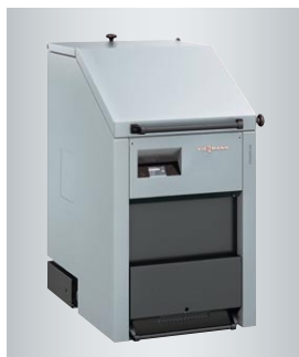
Vitoligno 250-S – kocioł na drewno (maksymalna długość polan drewna 50 cm)