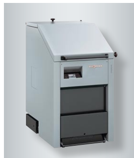
Kocioł na drewno Vitoligno 250-S, 40–75 kW (do 170 kW)

Regulator zdalnego sterowania Vitotrol 350 z dotykowym wyświetlaczem został wyróżniony przez Centrum Nordrhein-Westfalen nagrodą red dot design award 2014