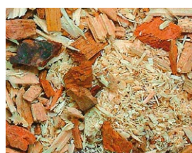
Kocioł Vitoligno 250-S na: drewno kawałkowe, szczapy i resztki drewniane lub brykiety drzewne

Kocioł na szczapy, drewno kawałkowe, brykiety drzewne i drewno odpadowe.