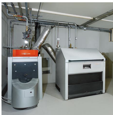
Kocioł Vitoligno 250-S współpracujący z kotłem Vitoplex 300