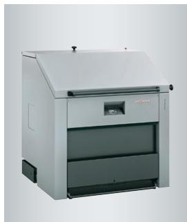
Vitoligno 250-S – kocioł na drewno (maksymalna długość polan drewna 100 cm)