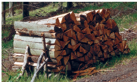
Ogrzewanie drewnem - najbardziej naturalnym paliwem na świecie

Kocioł Vitoligno 150-S pracuje z modulacją mocy i dopasowuje się bezstopniowo do aktualnego zapotrzebowania na ciepło. Układ regulacji spalania z sondą lambda i czujnikiem temperatury spalin rejestruje zawartość tlenu w spalinach i temperaturę spalin, dbając o niskie emisje substancji szkodliwych i wysoką sprawność kotła, do nawet 93,1%. W ten sposób Vitoligno 150-S oszczędnie pozyskuje z polan drewna użyteczne ciepło.