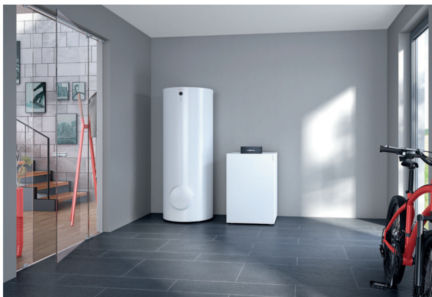
Pompa ciepła Vitocal 200-G z pojemnościowym podgrzewaczem c.w.u. VitoCell 100-W (z lewej)

Vitocal 200-G posiada certyfikat KEYMARK