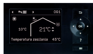
Wyświetlacz regulatora Vitotronic 200 (typ W01C)

Etykieta klasy efektywności energetycznej (ErP) pompy ciepła Vitocal 200-G, BWC 201.B13