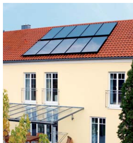
Vitosol 200-FM Dom dwurodzinny w Geisenfeld