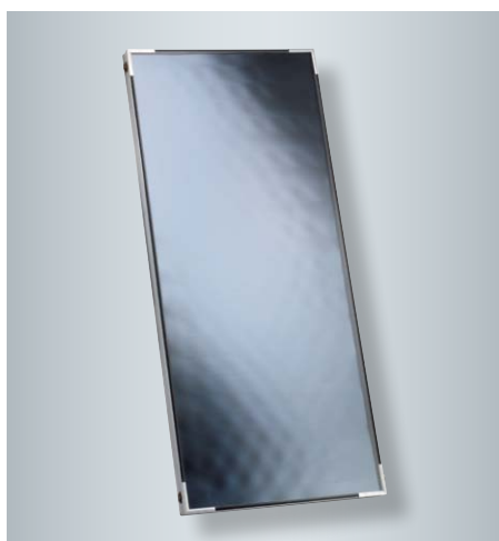
Kolektor płaski Vitosol 100-FM