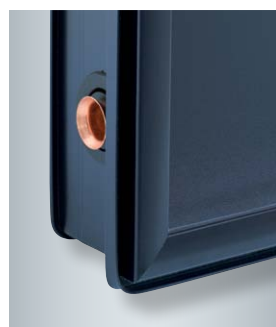
Rama kolektora ze specjalnym profilem do wbudowania kolektora w pokrycie dachu

Z kolektorami Vitosol 200-FM i Vitosol 100-FM nie musimy nic robić. Wyposażone są w system ThermProtect, który wyłącza kolektor jeśli ten za bardzo się nagrzeje.