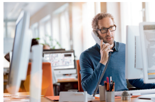
Dokładny przebieg prac należy ustalić z Klientem indywidualnie wcześniej przez email lub telefon.

GIS proponuje rozważenie możliwości odłożenia rutynowych wizyty pracowników serwisowych w lokalach. Jeśli wizyta pracowników serwisowych ma charakter interwencyjny i jest niezbęd-