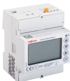
Miernik energii E380CA