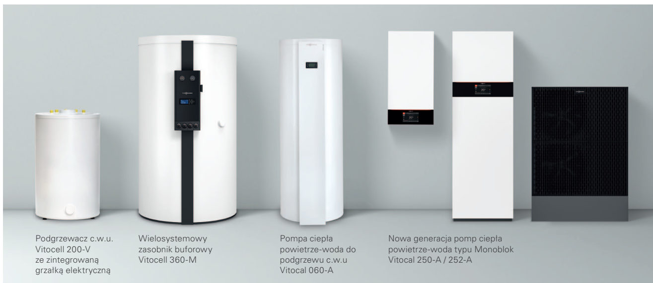
Podgrzewacz c.w.u. Vitocell 200-V ze zintegrowaną grzałką elektryczną