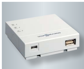
Vitoconnect 100 do bezprzewodowego połączenia z routerem

Aplikacja mobilna ViCare App stwarza nowe możliwości obsługi ogrzewania przez Internet. Graficzny interfejs użytkownika aplikacji ViCare umożliwia całkowicie intuicyjne obsługiwanie.