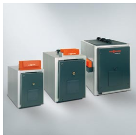
Rodzina kotłów Vitoplex 100 o mocy od 150 do 2000 kW

Dwuciągowy kocioł grzewczy Vitoplex 100 wykonany w jakościowym standardzie Viessmann przekonuje swoją niezawodnością eksploatacyjną i atrakcyjnym stosunkiem ceny do wartości. Kompaktowa budowa i mała wysokość konstrukcyjna pozwalają wstawić go wszędzie, także do niskich pomieszczeń.