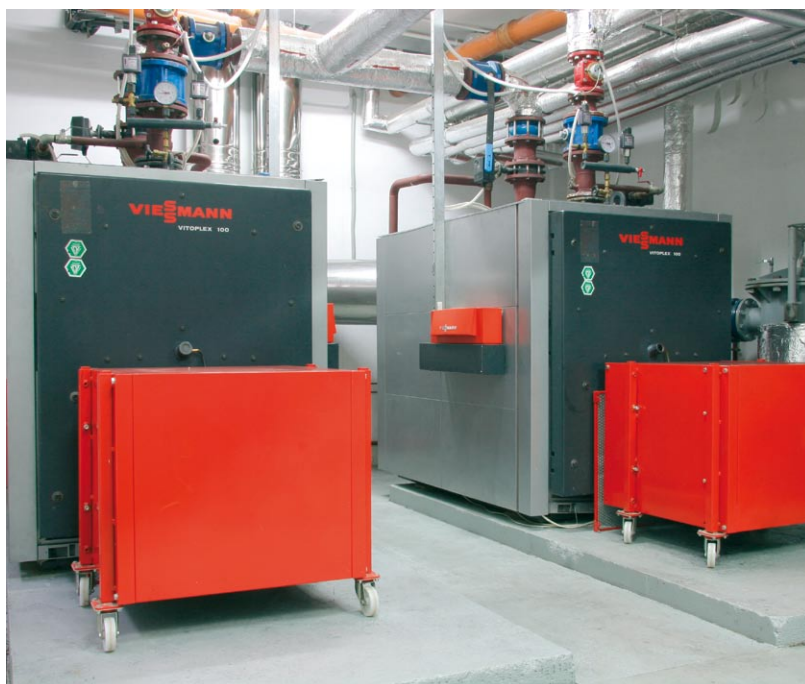
Kaskada z dwóch kotłów Vitoplex 100 o mocy 2000 kW

Kocioł Vitoplex 100 PV1 dedykowany jest do instalacji wysokotemperaturowych (pow. 75°C). Automatyka kotłowa Vitotronic 100 GC1B posiada funkcje ochrony kotła przed zbyt niskimi temperaturami wody na powrocie przez co zabezpiecza kocioł przed kondensacją spalin i tym samym przed niekorzystnym działaniem kondensatu. Vitotronic 100 GC1B jest także podstawowym regulatorem do pracy kotła w układach kaskadowych pozwalającym na współpracę do 4 kotłów.