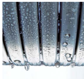
Wymiennik ciepła Inox-Radial – długowieczny i efektywny.