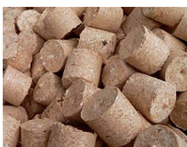
Kocioł Vitoligno 300-S na: drewno kawałkowe, szczapy i resztki drewniane lub brykiety drzewne