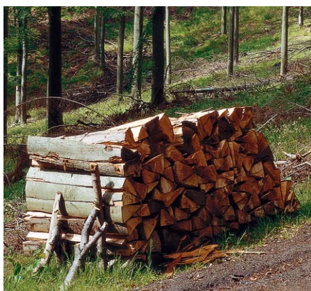
Drewno w kawałkach