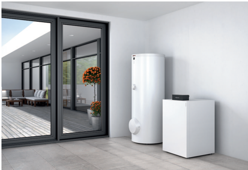
Pompa ciepła Vitocal 300-G z pojemnościowym podgrzewaczem c.w.u. Vitocell 100-W (poj. 300 litrów)