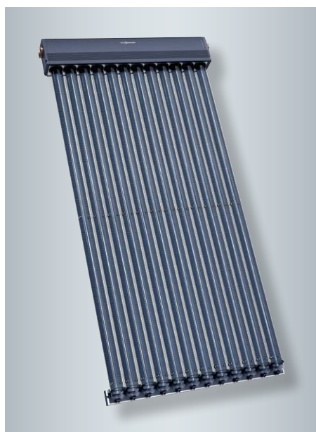
Wysokowydajny próżniowy kolektor rurowy Vitosol 300-TM, typ SP3C