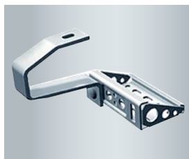
Prosty i bezpieczny montaż kolektora np. na hakach krokwiowych