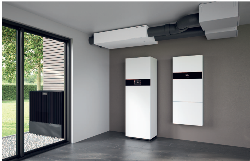
System wentylacji mieszkań Vitoair FS z pompą ciepła powietrze/woda Vitocal 252-A i systemem magazynu prądu Vitocharge VX3

Centralny system wentylacji mieszkań Vitoair FS zapewnia zdrowy klimat pomieszczeń i przyjemne temperatury w całym domu.